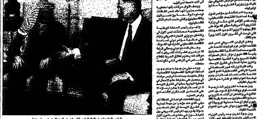
الرئيس كليون من استضافة الرئيس الفلسطيني في البيت الابيض اس

كليتون يعلن تقديم مساعدة للفلسطينيين بقيمة 400 مليون دولار